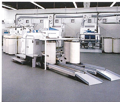
Kardengruppe TC 03 mit Trützschler Strecke TD 03

für Qualität und Produktivität der Anlagen im Technikum und beim Kunden. Der Gesamtumfang der Prüfungen liegt bei über 7'500 Proben je Jahr. Alle Prüfgeräte liefern ihre Daten direkt in einen zentralen Server. Hier erfolgt die Aufbereitung und Umsetzung in aussagekräftige Grafiken. Der Ausdruck der Resultate kann in 6 verschiedenen Sprachen erfolgen. Als erwünschter Nebeneffekt finden die gewonnenen Erfahrungen unmittelbaren Eingang in die Entwicklungsabteilungen von Trützschler.