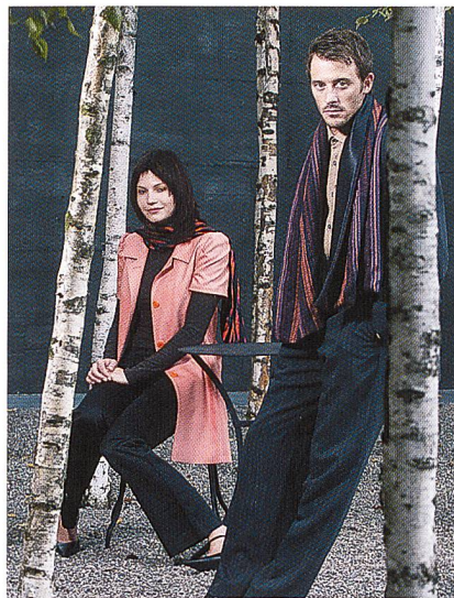
Schals von Weisbrod

Weisbrod-Schals tragen Namen von geheimnisvollen Inseln und traumhaften Destinationen. Je nach Jahreszeit und ausgewählten Materialien wärmen oder kühlen die Schals oder lassen sich als modische Schmeichelei oder betörender Schmuck vom Träger respektive von der Trägerin drapieren. Je nach Lust und Laune, mal klassisch, mal experimentell.