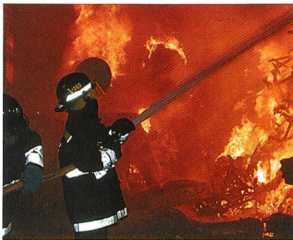
Flammschutzkleidung mit Copolyester-Schmelzklebstoffen

Ein erhöhtes Sicherheitsbewusstsein in der Bevölkerung und verschärfte Brandschutznormen führen zu einem steigenden Bedarf von flammhemmenden Produkten. Auch entsprechend ausgerüstete Klebstoffe werden am Markt gefordert. Dies gilt besonders für die Bereiche Bau, Automobil, Elektrotechnik und Möbel, wo Vorschriften den Einsatz von flammgeschützten Schmelzklebern notwendig machen. Das Schweizer Unternehmen EMS-GRILTECH hat sein Produktsortiment den steigenden Bedürfnissen angepasst und die flammhemmenden Eigenschaften der GRILTEX Copolyester weiter verbessert.