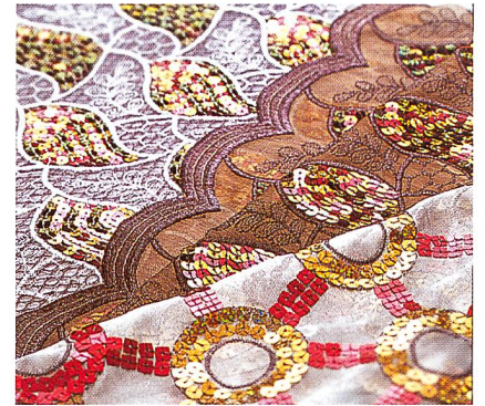
Stoffe mit Kombinationen von Soutache und Pailletten

Aufgrund der Zusammenarbeit mit dem Spezialisten auf dem Gebiet der Pailletten- und Soutacheeinrichtungen, der Firma Micro Corp., kann von Anfang an mit einer schon bewährten Konstruktion gearbeitet werden. Die Besonderheit ist die hervorragende Einbindung in die bestehenden Saurer-Hochleistungs-Stickmaschinen Epoca, Unica und 5040 E. Somit erhält der Kunde das Beste von zwei Spezialisten, hat aber nur einen Ansprechpartner. Saurer garantiert für diese Zusatzeinrichtung ebenso wie für sei-