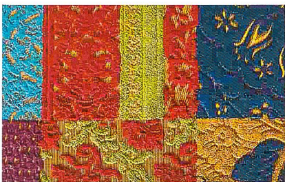
Abb. 1: Samtmuster