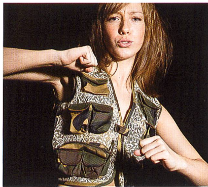
Abb. 1: Das passende Supergirl-Dress

Welche Frau möchte nicht einmal gern Lara Croft sein, um sich mit ebenso eisernem Willen wie gestähltem Körper einfach zu nehmen, was ihr zuzustehen scheint – besonders im heiss umkämpften Terrain rund ums spannungsgeladene Miteinander der Geschlechter. Untenstehend findet sich das passende Supergirl-Dress