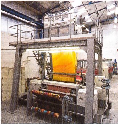
Abb. 3: Die Samtwebmaschine Velvet Tronic VTR33

hezu unbegrenzte Mustervielfalt möglich. Für jedes Muster lassen sich neue Gewebestrukturen entwickeln. Für trendige Samtqualitäten und moderne Muster können mit den neuen Schuss-elektoren dem Schusseintragsgreifer beispielsweise Effektgarne vorgelegt werden. Die VTR33 kann mit dem Netzwerk We@velink verbunden werden. Damit lassen sich die entwickelten Muster ohne manuelle Eingriffe direkt an die Webmaschine senden.