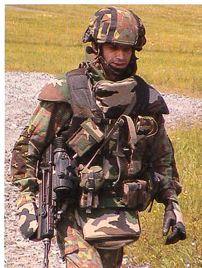
Passgenaue Prüfung von Kleidung für den militärischen Einsatz: die Simulations-Software M.A.C.A.O. von Telmat Industrie.

M.A.C.A.O. sowohl unbekleidete als auch voll bekleidete und ausgerüstete Personen anhand von deren anthropometrischen Daten und Körpermassen beschreiben. Mit Hilfe von Markierungen führt M.A.C.A.O. die Messungen vollautomatisch durch. Die Untersuchungen können im statischen und im dynamischen Zustand vorgenommen werden. Im letzten Fall charakterisiert das Messsystem einfache Bewegungen, wie Stehen, Auf-dem-Bauch-Liegen, Sitzen und reflexartige Bewegungen. Die Tests bewerten die physikalischen Belastungen der Kleidung hin-