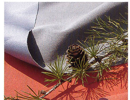
Abb. 2: c_change™

Bei Schoeller findet der Bekleidungshersteller zum einen elastische und Nonstretch-Gewebe in unterschiedlichen Gewichtsklassen und mit unterschiedlichem Stretchvolumen. Individuell zum Oberstoff – beispielsweise einem hochelastischen dynamic-Allround-Gewebe – kann nach Bedarf eine elastische Membran wie die neue «bionic climate membrane» c_change™ (Abb. 2) oder eine Acrylatbeschichtung kombi-