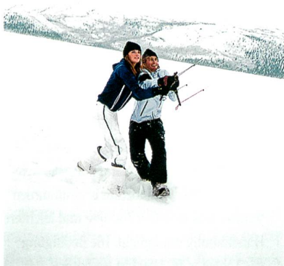
Schneespass mit Tommy Hilfiger und Sympatex