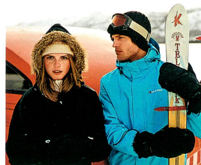
Die neue Ski-Kollektion

Membransysteme folgen einem ganzheitlichen Komfortkonzept in unterschiedlichsten Anwendungsfeldern.