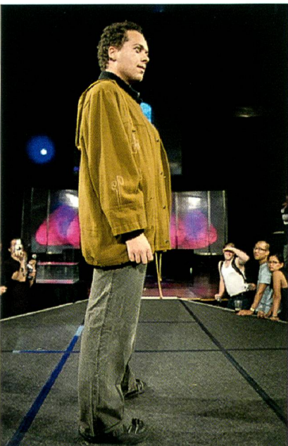
Abb. 7: Kompassjacke

Die meisten Menschen wählen ihre Kleider, um etwas damit auszusagen. Mit verschiedenen Parametern unserer Kleider kommunizieren wir mit unserem Umfeld. Stil, Farbe, Form, Muster oder Zeichen unserer Kleider zeigen oft die Stimmung der Persönlichkeit. Modeobjekte haben meistens ein starkes Image, das den persön-