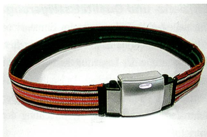
Abb. 3: QBIC-Gürtelcomputer

Ebenso muss technologisch gesehen eine Kombination zwischen elektrischen Geräten und elektrischen Textilien möglich sein. So lässt sich etwa der Computer in eine Gürtelschnalle integrieren, wo die Daten gesammelt werden (Abb. 3). Und da gibt es das so genannte AMON-