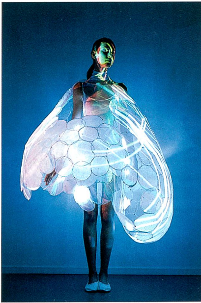
Abb. 6: Bubelle Dress

Man kann nicht behaupten, dass elektronische Kleidung dieselbe Entwicklung durchgemacht hat. Im Gegenteil. Sie soll die neusten Trends unterstützen. Ein solcher, interessanter Trend ist jener, welcher Produkten eine Identität verleiht, die mit Hilfe der Elektronik unsere Produktvielfalt bestärken.