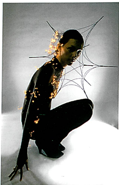
Abb. 5: Frisson Dress