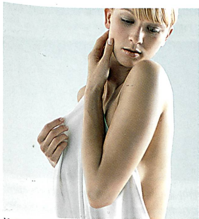
Natürliche Hautbalance; ©Foto: E. Grebe

TENCEL® sorgt durch die Kombination von Feuchtigkeitsmanagement und glatter Faseroberfläche für ein gutes Hautgefühl. Diese Eigenschaften sorgen für eine angenehme Kühlung auf der Haut, welche Hautirritationen verhindert und somit die Haut in natürlicher Balance hält. Untersuchungen zeigen, dass bereits 50% der Frauen und 40% der Männer angeben, eine sensitive Haut zu haben. Auch der Anstieg an Hauterkrankungen wie Neurodermitis und Psoriasis ist alarmierend. Besonders sensitive Haut reagiert schnell auf klimatische Einwirkungen wie Hitze und Kälte. Kommen noch physikalische und chemische Reizungen hinzu, reagiert die empfindliche Haut mit Rötungen, Jucken und Irritationen.