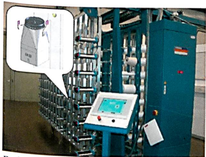
Fadenzugkraftregelung mit MULTITENS

Der VERSOMAT verfügt über ein Einsatzgebiet, das vom feinsten Seiden- oder Baumwollfaden bis zum größten Wollstreichgarn reicht. Die Ergonomie einer VERSOMAT Schärenanlage ermöglicht eine einfache und schnelle Bedienung. Zusammen mit der Prozesssteuerung liefert das die Basis für eine wirtschaftliche und qualitativ hochstehende Produktion von Muster- und Kurzketten.