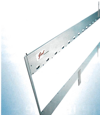
Abb. 2: Alfix-U, der universelle Webschaft aus Aluminium

GROB bietet für alle Webmaschinen die modernsten Zubehörkomponenten für die erfolgreiche Produktion von technischen Geweben. Entwickelt über Jahrzehnte mit speziellem Blick auf die Qualitätsanforderungen der «technischen Weber», sind GROB-Webschäfte und -litzen für ihre Qualität bekannt. Sie ermöglichen die Produktion von fehlerfreien technischen Geweben bei höchstem Nutzeffekt.