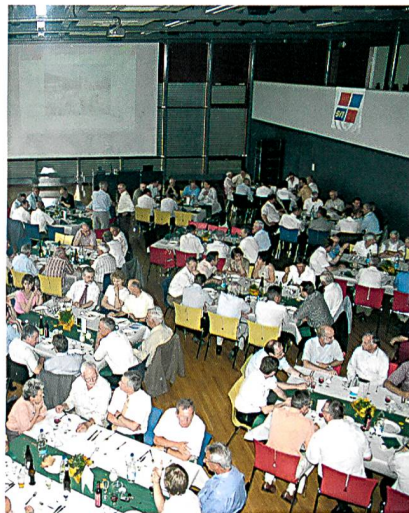
Gemeinsames Nachessen der Vereine SVT und SVTC

preis Schweiz, Solothurn, 2. November 2007