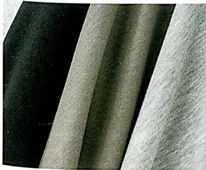
creora H-450, schwarz für Lingerie

on eingesetzt. Hyosung ist ausserdem einer der Hauptproduzenten anderer industriell hergestellter Fasern. Das Unternehmen hat ein Programm zur Reduzierung der Chemikaliennutzung und des Verbrauchs gestartet.