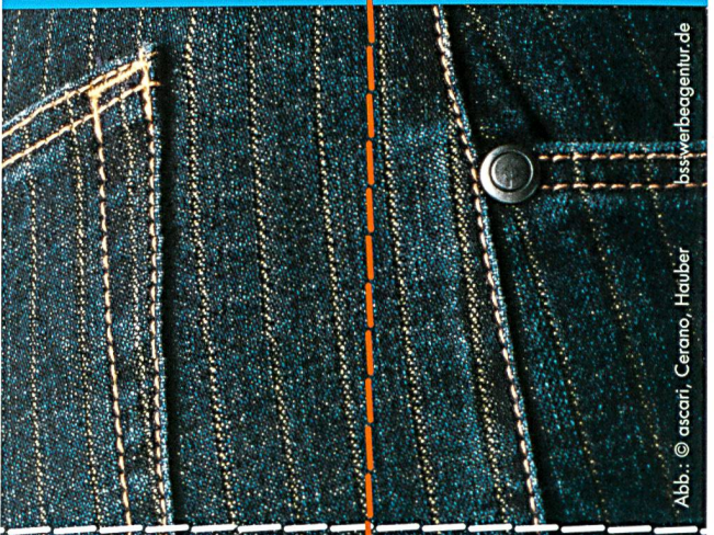
Abb.: © essari, Cerano, Hauber bsswvbeagentur.de