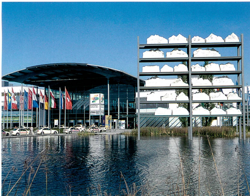
Eingang West mit Messesees; Foto: Alex Schelbert

Insgesamt präsentierten 1'451 Unternehmen aus 38 Ländern den Besuchern und Mitbewerbern auf 102'000 Quadratmetern die neuesten Entwicklungen und technischen Innovationen für die gesamte textile Kette. Diese Bandbreite wird insgesamt sehr hoch eingeschätzt: 67% der Besucher und fast 65% der Aussteller stellten der ITMA 2007 deutlich bessere Noten als den Vorveranstaltungen aus. «Uns als Veranstalter freut diese hohe Wertschätzung der Messeteilnehmer für unsere professionelle Messeorganisation, unser hochmodernes Messegelände und