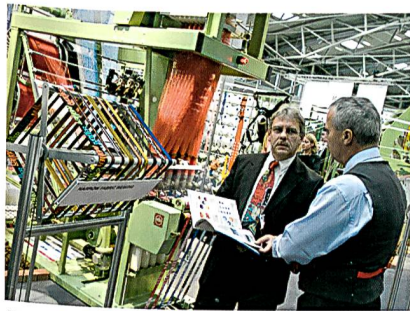
Facbdiskussionen am Stand; Foto: Alex Schelbert