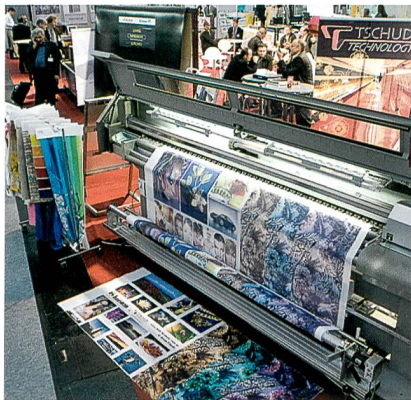
Tschudi Technology aus Wattwil auf der ITMA 2007 in München

haben hier eine fantastische Besucherqualität mit Leuten aus aller Welt erlebt – auch mit Top-Leuten, die man sonst nur ganz selten sieht. Wir sind wirklich hochzufrieden.»