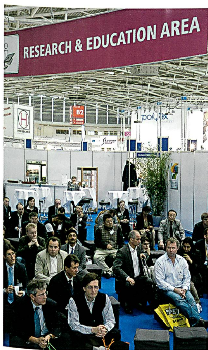
Research & Education Center; Foto: Alex Schelbert