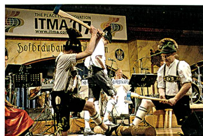
München – die Weltstadt mit Herz. Abendveranstaltung der ITMA 2007

Unser Messeziel ist es, uns auf Innovationen zu konzentrieren. Unsere vier Hauptexp-