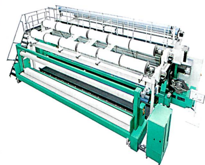
Abb. 4: Die RS MSU S

Die Hochleistungs-Raschelmaschine (Abb. 4) mit parallelem Schusseintrag wirkt die Schuss- und Stehfäden gestreckt in 90°- bzw. 0°-Lagen ein und fixiert diese mustergerecht mit den Wirkfäden der vorderen Legebarren. Das Ergebnis: Textilien mit einer äußerst hohen Reiss- und Weiterreissfestigkeit sowie mit einer eigenen, vielseitigen Optik.