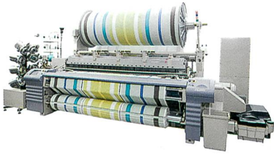
Abb. 12: Die Frottierwebmaschine ZAX9100-Terry von Tsudakoma mit «Versa-Terry-System»

maschine ZAX9100-Terry erlaubt die Herstellung von Frottiergeweben mit unterschiedlicher Polhöhe in 3- bis 7-Schussbindung. Das «Versa-Terry System» (Abb. 12) umfasst unter anderem den Schusseintrag mit niedrigem Luftdruck. Zusammen mit anderen Massnahmen lassen sich 10 % des Luftverbrauches einsparen.