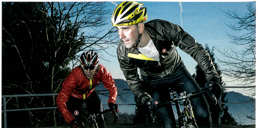
Abb. 1: Wind- und wasserabweisende Softshell-Jacke von Castelli/Italien aus Eschler e3 Textil (Eschler-Kollektion Herbst-Winter 2008-09)

Eschler ist es gelungen, seine Spacerknit-Stoffe als «das wahre Softshell» zu vermarkten und diverse Konfektionäre von Outdoorbekleidung von den zahlreichen Vorzügen dieser Stoffe gegenüber «konventionellen Softshells» zu überzeugen. So kommen diese Qualitäten nicht nur für hochfunktionelle Outdoor-Softshelljacken zum Einsatz, sondern werden auch für die