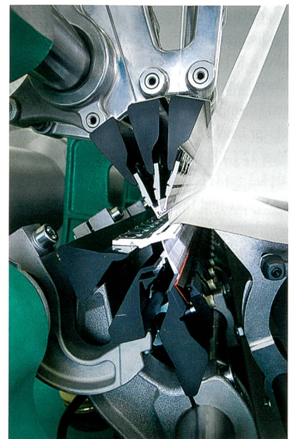
Abb. 1: CFK-Barren an der HKS 3-M

Zur ITMA 2007 wurde erstmals eine neue Maschinengeneration mit CFK-Barren in Serie vorgestellt (Abb. 1). Damit diese die durch den neuen Werkstoff verliehenen Leistungspotenziale voll entfalten kann, wurde das gesamte technische Konzept der Wirkmaschine überarbeitet.