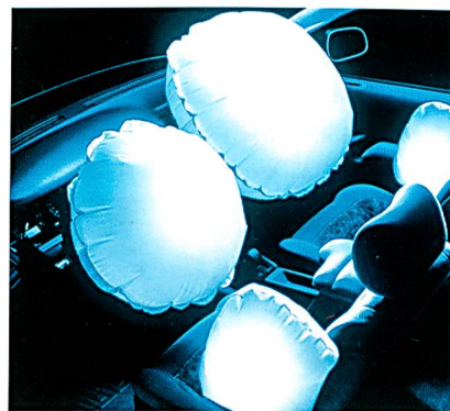
Haupt- und Seiten-Airbags

Die thermisch stark belasteten Nahtpositionen im Bereich der Einlassöffnung am Generator werden aufgrund ihrer weitaus höheren Belastbarkeit in der Regel mit Aramid-Multifilamentzwirnen (Meta/Para-Aramid) genäht. Zur Unterstützung der NähSicherheit, insbesondere bei den multidirektional verarbeiteten