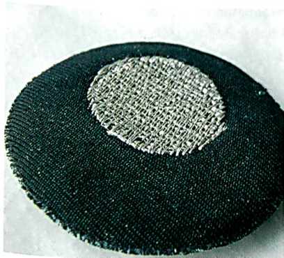
Die textile Elektrode aus mit Silber beschichteten Garnen ermöglicht Langzeit-EKG-Messungen

dem Target, beschleunigt, wobei Silberatome herausgeschlagen werden, die zur Beschichtung auf den Garnen führen. Bei diesem so genannten Sputterprozess bauen sich die Schichten Atomlage für Atomlage auf, wodurch die Schichten im Nanometerbereich kontrolliert werden können.