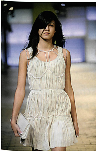
Abb. 3: Swiss Textiles Award 2007

me und Bekleidung sind unvermeidlich miteinander verbunden. Wärme-empfindliche Stoffe, die auf Berührung und die natürliche Körperwärme reagieren, erfahren eine plötzliche Ver-