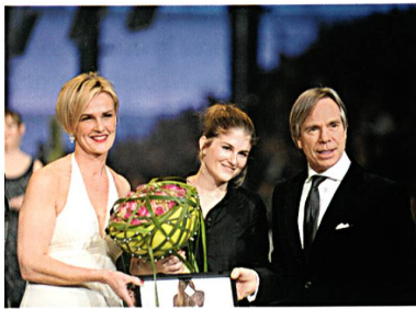
Abb. 4: annabelle Award wird von Tommy Hilfiger übergeben