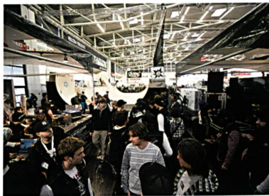
Abb. 2. Dichtes Gedränge im Board-Bereich, Quelle: ispo winter

Das bestimmende Thema der Branche auf der diesjährigen ispo winter war der Einsatz wieder verwendbarer und ökologischer Materialien und die nachhaltige Produktion der Sportarti-