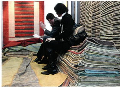
Abb. 10: Teppiche, Quelle: Messe Frankfurt Exhibition / Thomas Fedra

le oder geometrische Reliefdekore, die sich fast über die gesamte Teppichbreite erstrecken und bekommen so Bild-Charakter. Trotz der Mustergrösse wirken sie nicht laut, weil sie meist einfarbig gehalten sind. Insgesamt überwiegen grafische Dekors – Streifen, Quadrate, Kreise. Schachbrett-Dessins in zwei oder mehr Farben sieht man in vielen Kollektionen. Klassische Blütendessins werden modern modifiziert, hier und da auch mit strengen Streifen kombiniert. Die Farben sind wie bei den Stoffen zurückhaltend und angenehm unspektakulär – Aubergine, Graublau, Nougat oder Sand, aufgefrischt durch Dekore in Salbeigrün, Blassgelb oder Rosé.