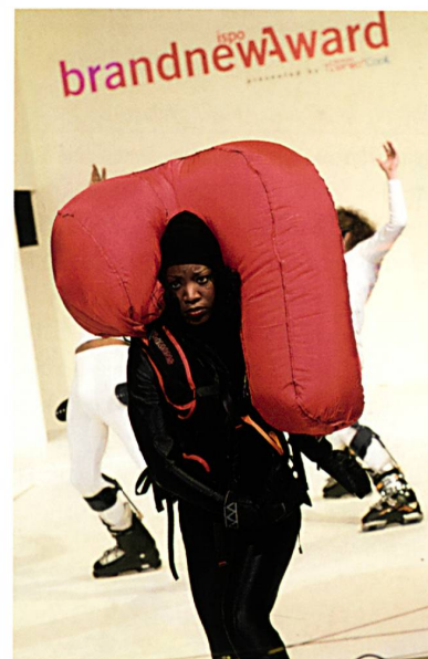
Abb. 3: Der Airbag für die Piste