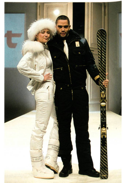
Abb. 1: Wintersport und Bekleidungslinien

Das Zusammenwachsen von Sport und Lifestyle schreitet immer weiter voran. «Die Nachfrage im Sportstyle-Segment ist besonders stark. Dies wird auch durch die Zusammensetzung der Fachbesucher deutlich: «Der Trend, dass sich immer mehr Händler