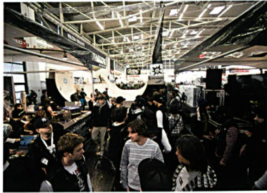
Abb. 2. Dichtes Gedränge im Board-Bereich, Quelle: ispo winter

Das bestimmende Thema der Branche auf der diesjährigen ispo winter war der Einsatz wieder verwendbarer und ökologischer Materialien und die nachhaltige Produktion der Sportarti-