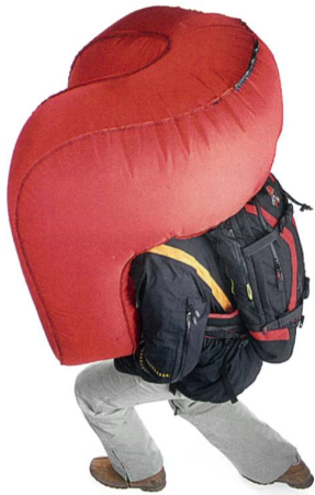
Abb. 4: Snowpulse

genau an diesen Stellen an. Durch den Zug an einer Schlaufe wird das luftbasierte System ausgelöst und innerhalb von 3 Sek. wird der Gefährdete durch den 150l Airbag um Kopf und Nacken geschützt. Gleichzeitig bildet sich ein Hohlraum um den Kopf des Verschütteten. Der Sauerstoff Zylinder kann immer wieder nachgefüllt und das System damit immer wieder eingesetzt werden. Snowpulse ist das zurzeit leichteste Lawinenrettungssystem auf dem Markt, ist EC zertifiziert und funktioniert bis -40 °C.