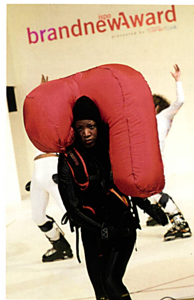
Abb. 3: Der Airbag für die Piste