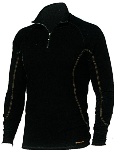
Abb. 1: °Climate Control-Oberteil mit langen Ärmeln und Reissverschluss von Marks & Spencer

Derzeit führt M&S ein langärmeliges Oberteil mit Reissverschluss (Abb. 1), ein kurzär-