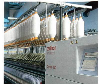
Abb. 6: Die Zinser 360 Ringspinnmaschine

Die Zinser 360, die in Shanghai mit dem automatischen Doffer CoWeMat gezeigt wird, ist eine innovative und hochproduktive Technologieplattform für feine und mittelfeine Ringgarne (Abb. 6). Die dauerhaft verlässliche Maschinen-