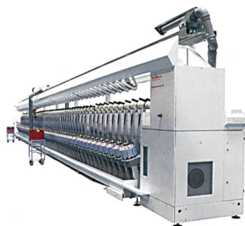
Abb. 1: Autoconer 5

Der Autoconer 5 (Abb. 1) ist ein wichtiger Mosaikstein im «Circle of Success» und ein eindeutiger Beleg für die Innovationsführerschaft von Oerlikon Schlafhorst auf dem Gebiet der Spul-