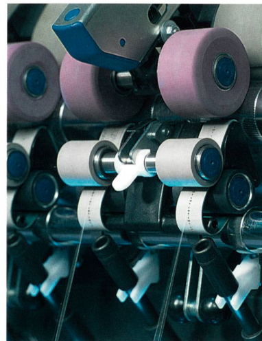
Abb. 5: Das Zinser CompACT 3 - System

Im Bereich der Kompaktgarne, sowohl beim Kurzstapelspinnen von Baumwolle, als auch beim Langstapelspinnen von Wolle, zeichnen sich die technologischen Details und Vorteile des Zinser CompACT 3 - Systems aus (Abb. 5). Die