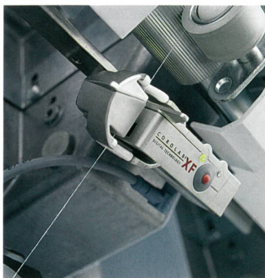
Abb. 4: Corolab XF

Weltweit vertrauen 95% aller Autocoro Spinnereien dem Corolab (Abb. 4). Im Autocoro 480