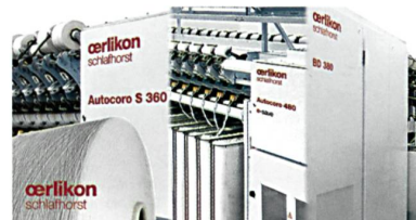
Abb. 3 Die Rotorspinnmaschinenfamilie von Oerlikon Schlafhorst

Oerlikon Schlafhorst stellt auf der ITMA Asia auch die Mitglieder der Rotorspinnmaschinenfamilie vor (Abb. 3), die mit neuen Leistungs-