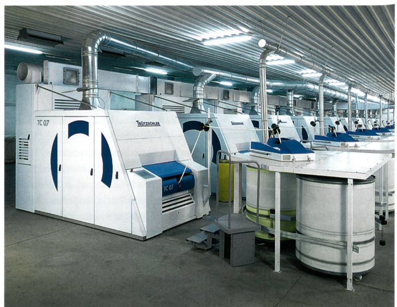
Abb. 1: Die neue Trützschler Hochleistungskarde TC 07

Im Zentrum des Standes zeigt Trützschler zum ersten Mal in Asien die neue Kämmmaschine TC0 1. Diese Maschine positioniert sich mit ihren 500 Kammspielen pro Minute am oberen Ende des Leistungsspektrums. Trützschler Card Clothing TCC zeigt Kardengarnituren aus neuen Speziallegierungen, die bisher unerreichte Standzeiten erreichen.