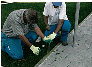
Randfixierung des Sportrasenfeldes

Der dereinst anfallende Abfall wiegt weniger als die Hälfte eines verfüllten Produktes. Dank dem Einzelelementsystem entsteht keine Materialvermischung. Die Entsorgungskosten betragen einen Bruchteil jener eines verfüllten Systems. Gemäss des T-Cycle™ Entsorgungskonzepts können SPORTISCA-Produkte auf umweltfreundliche und dennoch kosteneffiziente Art und Weise entsorgt werden. SPORTISCA benötigt keine Weichmacher oder Lösungsmittel. Im Gegenteil: Das unverfüllte System genügt derart hohen ökologischen Standards, dass es selbst in Grundwasserschutzzonen eingesetzt wird. Durch die aktive GUT-Mitgliedschaft (Gemeinschaft umweltfreundlicher Teppichboden) erfolgt die Produktion von SPORTISCA entsprechend den strengsten ökologischen Richtlinien.