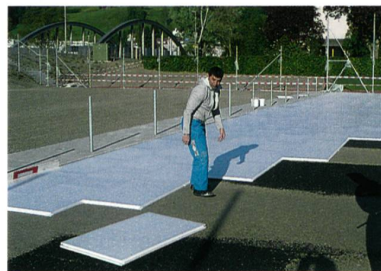
Verlegen der Unterlagsplatten

Entsorgungsproblematik zu denken. Somit lag das Entwicklungsziel auf der Hand: Es sollte ein künstliches Grün entwickelt werden, welches das natürliche Vorbild möglichst gut imitiert, optimale sportfunktionelle Eigenschaften aufweist, ohne Granulat auskommt und aus gesundheitlicher Sicht empfehlenswert ist.