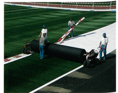
Ausrollen der Sportrasenbahnen

Von der Natur inspiriert, für Athletinnen und Athleten perfektioniert ist SPORTISCA eine getreue Abbildung des natürlichen Rasens – echt und sympathisch. Unabhängig von Wind, Wetter und Beanspruchung bietet der neue Rasen sportfunktionelle Eigenschaften gemäss dem FIFA I-Stern Standard. Die revolutionäre Trip-