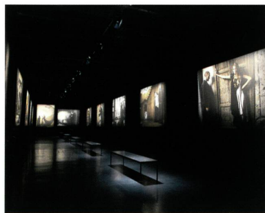
Abb. 4: Die Foto-Story mit WHOLEGARMENT-Kleidern

Es ist die Geschichte einer verbotenen Liebe, die in einem historischen Gebäude in Mailand aufgenommen wurde. Gerade einmal 20 Einstellungen waren nötig, um diese Geschichte zu erzählen (Abb. 4), und Mailand wurde als