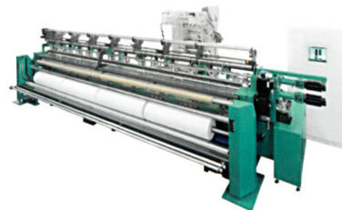
Abb. 3: RS 2 EL-F und RS 3 EL-F für die Herstellung von Verpackungsnetzen

Maschine umsetzen können – ohne die aufwändige iterative Kooperation mit KARL MAYER bei der Erstellung der benötigten Musterscheiben. Mit dem neuen, in KAMCOS® integrierten Muster-Editor wird das Muster direkt am Operator Interface unkompliziert eingegeben, bei verminderter Drehzahl gearbeitet und ebenso einfach an die Wünsche des Kunden angepasst (Abb. 3).