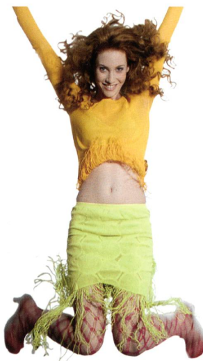
Abb. 1: Produkte der DJ 4/2, die von der Nippon MAYER Ltd. entwickelt wurde

Gemusterte, nahtlos gearbeitete Feinstrumpfhosen schmeicheln den Beinen, bieten höchsten Tragekomfort und dekorieren feminine Silhouetten mit verführerischen Effekten. Als i-Tüpfelchen der weiblichen Garderobe unterstreichen die maschigen Blickfänger die Anziehungskraft des anderen Geschlechts und inszenieren die Persönlichkeit höchst individueller Charaktere (Abb. 1). Dabei gilt: Hinter jeder erfolgreichen,