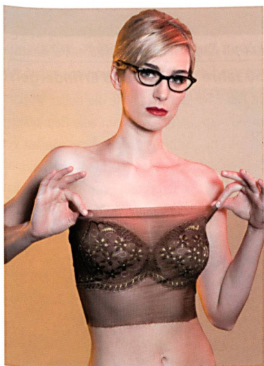
Abb. 2: Die TL 43/1/24 erfüllt die Wünsche der Damenwelt

TL 31/1/24 und TL 66/1/24 emanzipiertes Leistungsportfolio für die effiziente Produktion konfektionsoptimierter Qualitäten. Die Eckpunkte des Erfolgskonzepts dabei: Drehzahlen von bis zu 600 min -1 und gleichzeitig eine weit reichende Mustervielfalt durch 14 Musterlegebarren hinter dem Fallblech sowie Versatzwege von bis zu 170 Nadeln. Damit holt die neue Textronic®Lace grazil gestaltete Sterne vom Himmel und platziert sie in dichter Schar auf einem zarten ornamentalen Grund. Freistehend und mit gelblicher Unterlegung funkeln die gezackten Musterspots in bewegtem Ambiente in