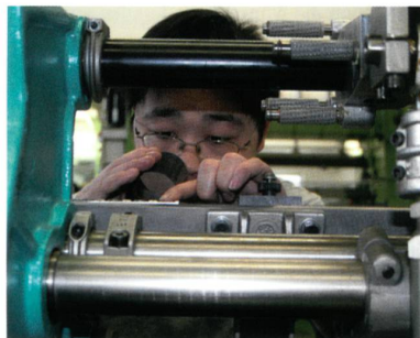
Abb. 4: Das Ausbildungs- und Trainingszentrum

Mit der Eröffnung der neuen Produktionsstätte KARL MAYER (CHINA) Ltd. gibt es nun auch in China eine KARL MAYER Academy. Das Ausbildungs- und Trainingszentrum für den asiatischen Raum gehört zur KARL MAYER China Ltd. und hat verschiedene, spezifische Wirkereikurse im Programm (Abb. 4). Die Lehr-