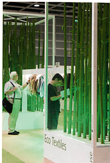
Abb. 2: Ecotextiles

Öko-Textilien sind ein langfristiger und weltweiter Trend. Als Wegbereiter für diesen Markt hat die Interstoff Asia Essential führende Prüfgorgane für Öko-Textilien und Ökologie-Experten eingeladen, um die neuesten Kenntnisse und Lösungen für brandheisse Fragen in der Branche zu bieten (Abb. 2).