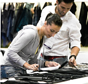
Abb. 1: Trend Forum

Für Besucher der Interstoff Asia Essential im Herbst 2008 wird sich die Teilnahme als äusserst fruchtbar erweisen: Sie können Anbieter vielerlei Mode-, Öko- und funktioneller Textilwaren treffen, branchenspezifische Kenntnisse von weltweit führenden Prüfgorganen für Öko-Textilien und Ökologie-Experten erwerben und ihr Produktwissen über neu freigegebene funktionale Textilwaren und verbesserte Symbole zur Funktionsidentifikation vertiefen (Abb. 1).