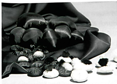
BA Abschlussarbeit 2007: Salomé Gut

Die textile Fläche offenbart Optik, Haptik und Funktionalität eines Stoffes für ein mögliches Anwendungsszenario. Flächenexperimente – konkret im Gewebe – integrieren und übersetzen neuartige funktionale Garne (von der EMPA oder anderen innovativen Institutionen entwickelt) in die textile Fläche. Erst die Fläche oder der Stoff können als Funktionsmuster für eine mögliche Anwendung herangezogen werden. Wir verfolgen dabei Fragen in Bezug auf die Wechselwirkung von Design, spezifischer Konstruktion und den daraus resultierenden stofflichen Eigenschaften aufgrund der Quantitätsanteile einzelner Materialien in der Fläche.