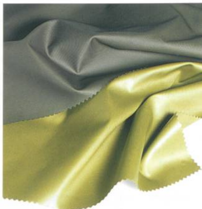
Abb. 1: Coating auf Polyester- oder Polyamid-Jackenqualitäten

Im Gegensatz dazu stehen Textilien mit wachsig nasser Optik – wie beispielsweise der goldfarbene Twill – die wundervoll glänzen und nicht selten an Lack und Leder erinnern. Dem aktuellen Used-Look entsprechen SFTC-Qualitäten mit Shape-Memory-Effekt und bleibenden, individuellen Markierungen, die jeder Jacke Einzigartigkeit verleihen werden. Werden ein zusätzlicher Witterungsschutz oder der praktische Selbstreinigungseffekt gewünscht, kommen die c_change™-Klimamembrane oder das Wasser und Schmutz abweisende NanoSphere® mit ins Spiel.