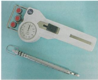
Abb. 5: Fadenspannungsmessgerät und Federwaage zur Überprüfung der Fadenspannung an der Nähmaschine

zuweisen. Die Fadenspannungswerte müssen exakt vorgegeben und regelmässig kontrolliert sowie dokumentiert werden. Die Überprüfung der Fadenspannung kann mit einer einfachen Federwaage oder, etwas exakter aber auch entsprechend teurer, mit einem Fadenspannungsmessgerät (Abb. 5) durchgeführt werden. Eine Prüfung «nach Gefühl», von Hand, ist in jedem Fall zu ungenau. Bei der Einführung der regelmässigen Fadenspannungskontrolle kann mitunter technische Unterstützung erforderlich sein, da sich viele Nähmaschinen nicht allein durch einen einfachen «Dreh» auf Fadenspannungswerte von maximal 100 cN justieren lassen.