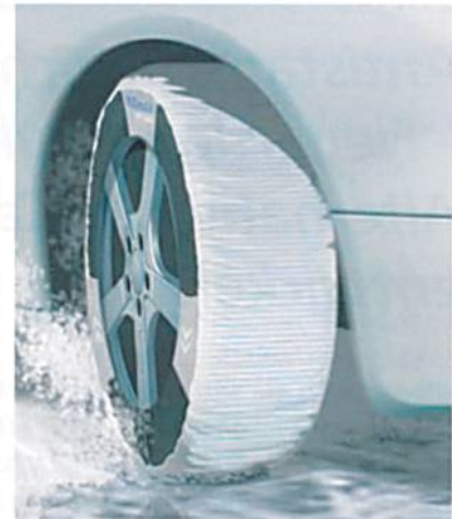
Abb. 2: RUDmatic Soft Spike: Patentierter Reifenüberzug auf Textilbasis

Das ITV begleitete die RUD-Gruppe auch bei der Serienproduktion und brachte die für die Fertigung