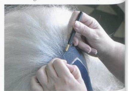
Abb. 4: Bobinet-Tüll für die Herstellung von Perücken

Der echte Bobinet-Tüll ist für die Herstellung von Perücken, Toupets, Schnäuzen und Bärten ein schier unverzichtbares Grundmaterial und hat ganz offensichtliche Vorteile gegenüber Wirk- und gewöhnlicher Webware (Abb. 4).