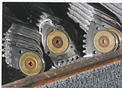
Abb. 5: Schützen mit garngefüllten Bobinen

Die Perry Street Factory in Chard/Somerset heisst heute swisstulle UK. In diesem Werk werden die legendären echten Bobinet-Tülle produziert. Die swisstulle-Gruppe verkauft die verschiedensten Bobinet-Produkte für die unterschiedlichsten Anwendungen in die ganze