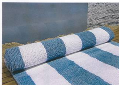
Badematten, Quelle – Messe Frankfurt Exhibition GmbH / Petra Welzel

Insgesamt verzeichnete die Heimtextil in diesem Jahr 2'721 Aussteller aus 64 Ländern. Sie ist damit die grösste internationale Fachmesse für Wohn- und Objekttextilien.