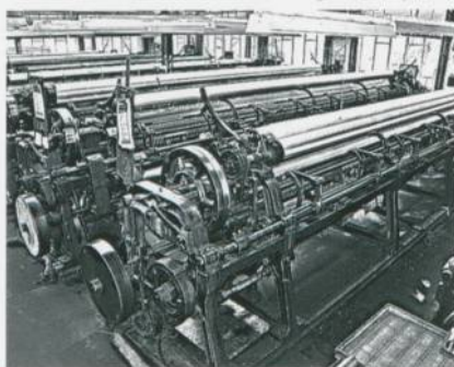
Abb. 1: Bobinet-Maschinen, erfunden von John Heathcoat im Jahre 1808

In der französischen Stadt TULLE, im Département Corrèze, wurde die Spitze erstmals nicht mehr in einem Arbeitsgang geklöppelt, sondern zunächst ein Netzgrund in zeitraubender Handarbeit angefertigt. Dieser Netzgrund wurde von da an Tüll (Tulle) genannt. Ende des 18. Jahrhunderts versuchte man, den Netz- bzw. Spitzengrund mechanisch herzustellen. Der erste Versuch gelang im Jahre 1765, als auf einem so genannten Strumpfstuhl ein tüllähnliches Gewirk hergestellt werden konnte – ein Produkt, das jedoch noch nicht befriedigte. Erst im Jahr 1808 wurde die erste Bobinet-Tüllmaschine gebaut und patentiert. Als Erfinder gilt der Engländer John Heathcoat aus Nottingham (Abb. 1). Der auf dieser Maschine hergestellte glatte,