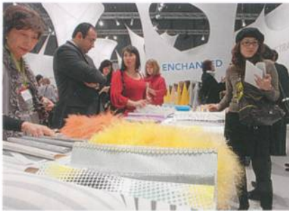
Besucher des Trend-Forums

beitsunterlage konzipierten Trend-Buch gelobt wurden. Das Trendforum zog in diesem Jahr mehr Besucher an als in den Jahren zuvor. Ein grosser Erfolg für die Mitglieder des Trendtable, der in diesem Jahr unter der Ägide des Stijlinstituut Amsterdam stand.