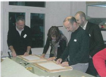
Teilnehmende beim Aufspannen der Bilder auf den Keilrahmen

Dank seinen kompetenten Ausführungen konnten sich die Teilnehmer ein Bild über die verschiedenen Drucktechnologien machen.