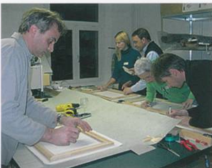
Teilnehmende an der Arbeit

Die Firma SAWGRAS Europe AG ist eine Tochter der SAWGRAS Technologies, Charleston, USA. Die Firma verfügt über eine 20-jährige Erfahrung in der Erzeugung von digitalen Tinten, und ist im Besitz von über 40 Patenten in diesem Bereich.