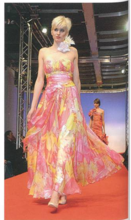
Tragbare Mode für jede Frau