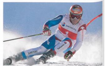
Didier Cuche

Während das Swiss Ski Team den Medaillenspiegel der Nationen für sich entscheiden konnte, war eine schweizerische Marke noch häufiger auf dem Podest präsent: Das Appenzeller Unternehmen ESCHLER holte sich in Val d'Isere 8 Gold-, 9 Silber- und 8 Bronzemedailles – das entspricht 25 von 30 möglichen Medaillen. Schliesslich fahren fast alle Nationen in Rennanzügen aus Eschler-Stoffen. Die technischen Funktionsmaterialien, aus denen die Rennanzüge gefertigt sind, unterscheiden sich bei den verschiedenen Teams zwar nur geringfügig, dennoch steht ein enormer Forschungsaufwand hinter der Entwicklung der Materialien: Sie müssen einerseits einen möglichst geringen Luftwiderstand aufweisen und andererseits den strengen Sicherheits-Regeln der FIS entsprechen.