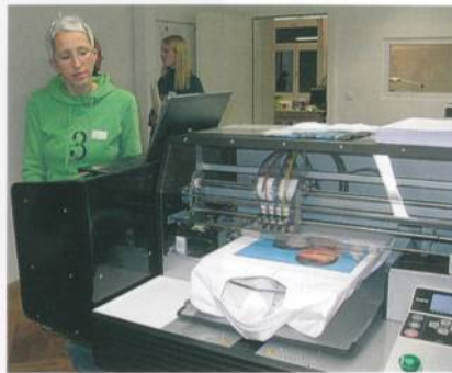
Brother Textildrucker GT-541