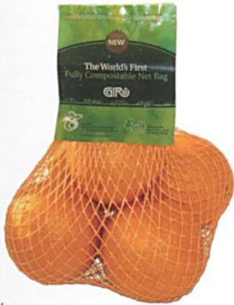
Polylactid (Biopolymer PLA) Ingeo®, NatureWorks LCC; Verwendung für Bekleidung und Verpackungen, vollwertig kompostierbar

werden. Kombischmelzgarne (mit Copolymer PA/PET) können standardmässig in der Fläche verarbeitet werden und lassen sich zusammen mit anderen Garnen anfärben. In normalen Prozessen wie Waschen und Thermofixieren lässt sich der Nahtersatz applizieren. Bei auf Taille zu schneidenden Textilien dient der Schmelzfaden als Kantenschutz und verhindert das Ausfransen. In Abhängigkeit des Schmelzpunktes eignen sich diese thermoplastischen Fasern auch als Trenngarn. Dabei lösen sich die «Haltefäden» unter Temperatur auf, sodass der Schlauch als Fläche oder die Fläche als «vorkonfektionierte» Warenbreite vorliegt.