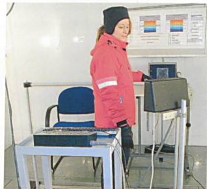
Mit Hilfe umfangreicher Testreihen mit Probanden wurde die Sensor- und Steuerungstechnik der beheizbaren Handschuhe optimiert

Durch die Zufuhr von Wärmeenergie über den Handschuh werden das Wohlbefinden und die Leistungsfähigkeit des Trägers deutlich verbessert und damit ein wichtiger Beitrag zu Komfort und Sicherheit auf Pisten und Loipen geleistet. Denn gerade bei kalten Umgebungstemperaturen reduziert der menschliche Körper vor allem die Durchblutung in der Peripherie, um den Verlust von Wärme so gering wie möglich zu halten. Dies gilt insbesondere für die Hände, über deren grosse Oberfläche im Verhältnis zur Masse besonders viel Energie verloren gehen würde. Während beim langfristigen Aufenthalt in der Kälte, wie es ohne Zweifel beim Skifahren der Fall ist, die wärmeisolierende Wirkung konventioneller Ski-Handschuhe darin besteht, vorhandene Körperwärme zu speichern, ist der Solaris in der Lage, zusätzliche Wärme zu produzieren und somit diesen physiologischen Prozess der Auskühlung vollständig zu verhindern. Bönningheim, im Februar 2009