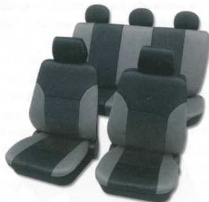
Karborgarne (konduktiv, elektrisch ableitend und antistatisch), Belltron®, Kanebo und Clarcarbo®, Kuraray; Verwendung für Autositzbezüge und Reinraumbekleidung

Die Trends setzen dabei Spezialitätengarne wie elektrisch leitfähige Karbonfasern (Clarcarbo®/Kuraray, Belltron®/Kanebo), Schmelzfasern (Grilon®/Ems-Chemie AG) oder biologisch abbaubare Synthefasern (Ingeo®/NatureWorks LLC).