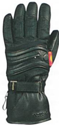
Wissenschaftler der Hohenstein Institute optimierten das Energiemanagement der beheizbaren Ski-Handschuhe der Reihe Solaris aus dem Hause Reusch, Foto: Reusch

Durch die exakt an die Temperaturverteilung der Hand angepasste Sensor- und Steuerungstechnik konnte die Effizienz des integrierten, selbstregulierenden Heizsystems erheblich gesteigert werden. Der Stromverbrauch bleibt dabei extrem gering. Diese revolutionäre Technologie, die fester Bestandteil der Reusch Handschuhserie Solaris ist, garantiert warme Hände für viele Stunden auf der Piste.