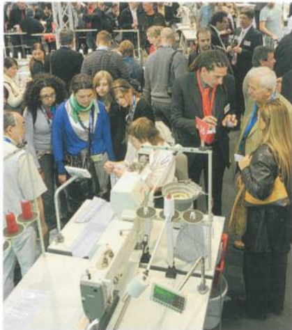
Dichtes Gedränge in den Messehallen

Adler AG, steht fest: «Es war die richtige Entscheidung, uns und unsere Neuheiten hier in Köln so stark zu präsentieren. Die IMB war und ist für uns die Weltleitmesse für Innovationen.»