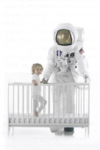
Abb. 1: Vom Weltall in die Matratze – auch die Kleinsten profitieren im Schlaf immer mehr von der intelligenten Outlast®-Temperaturregulierung. Outlast ist der Pionier und Marktführer bei Phase-Change-Materialien.