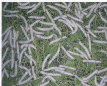
Abb. 1: Die Seidenraupe Bombyx mori

In Vorbereitung des Projektes fand eine Internetumfrage bei Konsumentinnen und Konsument statt. 65% der Befragten würden mit grosser Wahrscheinlichkeit Seidenprodukte aus Schweizer Produktion kaufen. Insgesamt sehen 90% die Qualität und 95% die Ökologie als zentrales Attribut dieser Seide. Kaufinteresse für Krawatten und Foulards zeigten 62% der Befragten und im Durchschnitt würde für derartige Produkte 19% mehr bezahlt.