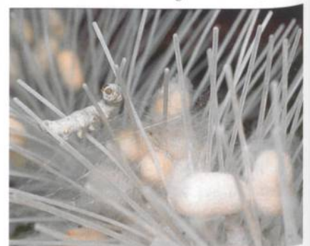
Abb. 2: Verpuppung

Die Seidenraupe (Abb. 1) ist die Larve des Seidenspinners. Die Seidenraupe häutet sich viermal, und sie ist 30 bis 35 Tage nach dem Ausschlüpfen aus dem Ei spinnreif. Die Spinnrüden der Raupe bestehen aus einem vielfach gewundenen Schlauch, dessen hinterer Teil das aus Proteinen bestehende Seidenmaterial absondert. Dieses wird durch dünne Ausführungsgänge zu der im Kopf gelegenen Spinnwarze und von dort aus dem Körper geleitet. Das aus der Spinnwarze austretende Protein-Material erhärtet sich an der Luft sofort zu einem Faden. Indem die Raupe beim Austreten des Materials gezielte Kopfbewegungen macht, legt sie um sich herum Fadenwindung um Fadenwindung. Nach dem anfänglichen Ausstoss einer unregelmässigen, lockeren Fasermasse, der so genannten Wattseide, ist sie in kurzer Zeit von einem dichten Seidengespinnst, dem Kokon, eingeschlossen (Abb. 2). Dieser Kokon besteht aus einem einzigen bis zu 900 m