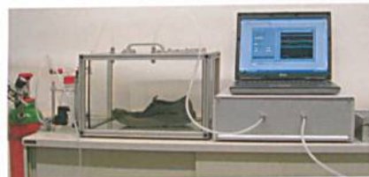
Abb. 2: Mit Hilfe der so genannten «Elektronischen Nase» soll künftig bereits bei der Entwicklung von Schuhen und Strümpfen das Potential für unangenehmen Schweißgeruch abschätzbar sein, Bild: PFI Pirmasens

aus Schuhen und Strümpfen unter realistischen Bedingungen getragen, um damit echten Schweißgeruch zu generieren. Parallel dazu wurde dieser über den Versuchszeitraum hinweg objektiv mit Hilfe der «Elektronischen Nase» (Abb. 2) und subjektiv durch ein «sensorisches