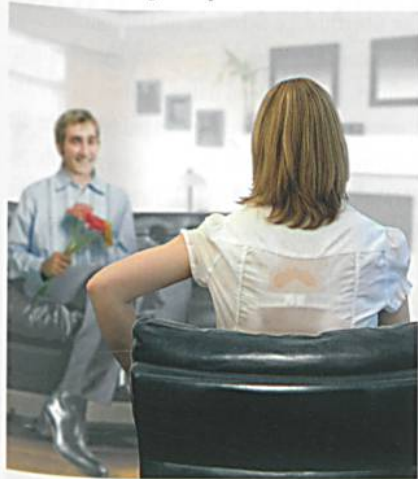
Abb. 2: Sitzen ohne Schwitzen – Mit dem neuen Outlast®-Bezugsstoff «Wellgonomics» von Microfibras wird das Schwitzen auf Polstermöbeln oder Bürostühlen deutlich reduziert.

Die Microfibras-Kollektion «Wellgonomics» wurde speziell für hochwertige Möbel- und Bürostuhlanbieter entwickelt (Abb. 2). Ein komplettes Marketingkonzept bietet darüber hinaus