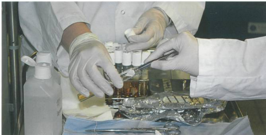
Die Bioindikatoren werden nach Durchlaufen des desinfizierenden Verfahrens von ausgebildeten Mikrobiologen direkt vor Ort aufbereitet

werden. Die Waschversuche wurden in der Wäscherei der Firma Busch Textilservice GmbH &