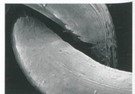
Rasterelektronenmikroskopische Detailaufnahme eines mit Zellen besiedelten Textilimplantates

d.h. sie können sich zum Beispiel in Herzmuskel-, Knochen- oder Knorpelzellen umwandeln. Die Ansiedlung von Stammzellen auf einem Textil eröffnet für die Regenerationsmedizin weitreichende therapeutische Möglichkeiten. Textilimplantate werden bei Operationen häufig eingesetzt, um verletztes Gewebe zu stabilisieren. So gibt es z. B. Herz-Patches aus Biomaterialien, die bei Herz-Operationen auf das geschädigte Herz aufgebracht werden. Die eingebrachten Fremdkörper werden dann nach einer gewissen Zeit vom Körper des Patienten abgebaut.