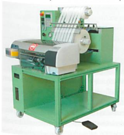
Abb. 2: Der Müller Digital Printer MDP2 MÜPRINT2

Der Müller Digital Printer MDP2 MÜPRINT2 (Abb. 2) hat einen piezoelektrischen Druckkopf,