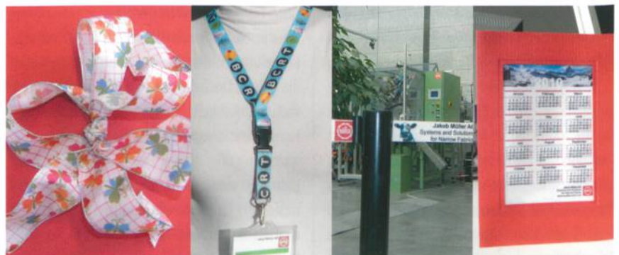
Abb. 1: Produktbeispiele, bedruckt mit dem MDP2 MÜPRINT2

Vorteilhaft beim Inkjet-Direktdruck ist, dass die Tinte ohne Zwischenschritte aufgebracht wird, nicht wie beispielsweise beim Transferdruck