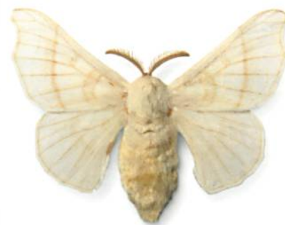
Abb. 1: Bombyx mori

nicht in einer reinen Monokultur, sondern gedeihen nach biologisch-dynamischen Methoden zusammen mit Hunderten von Obst- und anderen Bäumen.