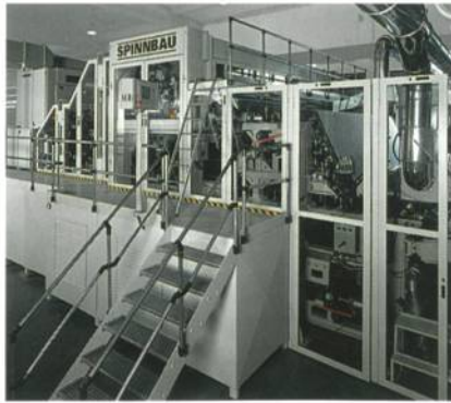
Abb. 1: Krempelanlage von DiloSpinnbau

Innerhalb der letzten Monate konnte DiloSpinnbau deshalb vier solcher Krempelanlagen bei namhaften Herstellern in Arbeitsbreiten zwischen 3,70 und 5,10 m platzieren (Abb. 1). Die Be-