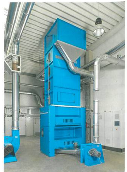
Abb. 3: Baltromix-System

Einspeisung. Ein optimaler Öffnungsgrad wird u. a. durch den Krempelwolf und die Feinöffnungsstufen erzeugt, die die Flockengrösse festlegen. Deshalb wird die Feinöffnungsstufe beim neuen Dosieröffner DON der DiloTemafa direkt vor dem Krempelspeiser positioniert. Dosieröffner und Krempelspeiser müssen auch regelungstechnisch als einheitliches, zusammenwirkendes System betrachtet werden. Nur so ist ein kontinuierlich gleichmässiger Fasermassenstrom erreichbar, der für die gleichmässige Dosierung der Einspeisung so wichtig ist.