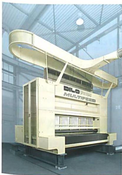
Abb. 4: Multifeed

Der Multifeed Krempelspeiser von Dilo Spinnbau schlägt ein neues Kapitel bei modernen Krempelspeisesystemen auf. Die Twinflow Doppelzuführung und die Komprimierung der Flockenmatte im Unterschacht bewirken eine bisher ungekannte Einspeisequalität, die so die Gleichmässigkeit des Krempelflors steigert und Einsparungen an Fasermassen ermöglicht. Da der Multifeed ohne langwierige Einregelungszeiten quasi ad hoc mit maximaler Gleichmässigkeit einspeist, werden auch die Minderqualitätsmengen beim Anfahren und Abstellen der Gesamtanlage reduziert. Der Multifeed wird in Arbeitsbreiten von bis über 5 m angeboten.