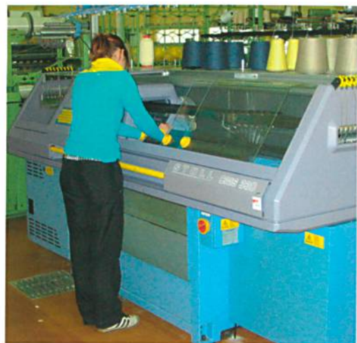
Anwendung der Theorie, hier an der Fully Fashion Flachstrickmaschine

Die interdisziplinäre Zusammenarbeit mit namhaften, hoch spezialisierten Bekleidungsherstellern, der ETH Zürich oder der EMPA, Forschungsinstitution für Materialwissenschaften und Technologie, wirkt durch die Praxisorientierung stark motivierend auf die Studierenden. Dabei spielt die Beteiligung der STF am Innovationsnetz Swiss Tex Net eine grosse Rolle. Innovationstage, Workshops, Beratungen und Projektarbeiten mit in- und ausländischen Partnern stehen dabei im Vordergrund.