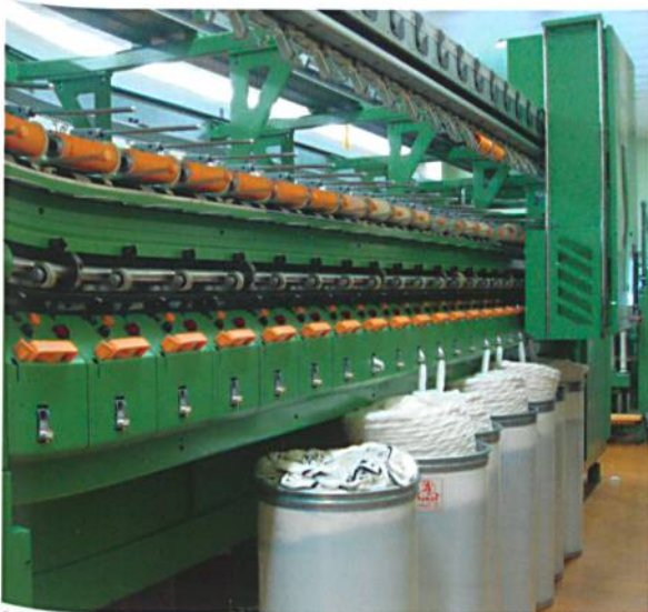
Open-End Spinnmaschine im Technikum Wattwil

In Projekten testet und optimiert die STF neue Materialien, Maschinen und Prozesse. So beschäftigen sich die Studierenden in den schuleigenen Labors zum Beispiel mit smarten Funktionen von Textilien. Die Nanotechnologie ist ein weiterer aktueller Forschungsbereich, bei dem die Erfahrung der STF einfließt. Das Potenzial einer Innovation auszuloten und deren Verkauf durch Marketingkonzepte zu unterstützen, sind spannende Themen für Studierende und Lehrpersonen.