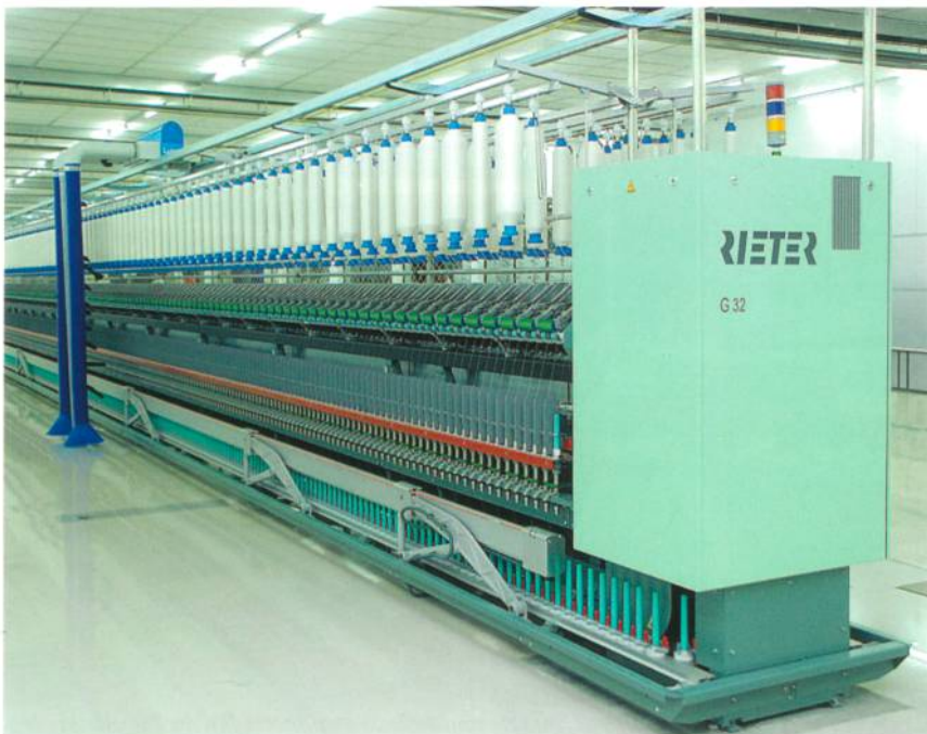
Abb. 1: Ringspinnmaschine G32

72 kg/h Kammzug – das ist die reale Leistung der halbautomatischen Kämmaschine E 66 (Abb. 2). Ihre Entwicklung basierte auf der Basis der jahrelangen Erfahrungen auf dem Gebiet des Kämmens, mit mehr als 7'800 verkauften Maschinen. Zusammen mit dem Computer-Aided-Process-Development – C•A•P•D500 – wurde der Kämmprozess hinsichtlich Bewegungsablauf, Belastung der Arbeitswerkzeuge sowie Luft- und Energieverbrauch optimiert. Die hohe Leistung von 72 kg/h wird unter einem idealen Laufverhalten und höchster Qualität bei 500 Kamm-