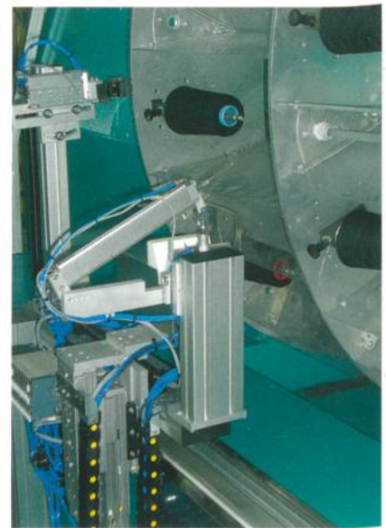
Abb. 3: Knotenrichtung

Der Spulenwechsel- und Knot-Roboter an der Gir-O-Matic ist seit März 2009 in der Praxis im Einsatz und bewährt sich hier äusserst erfolgreich. Bei Kettlängen von durchschnittlich 200 m ist die Verfügbarkeit der Maschine