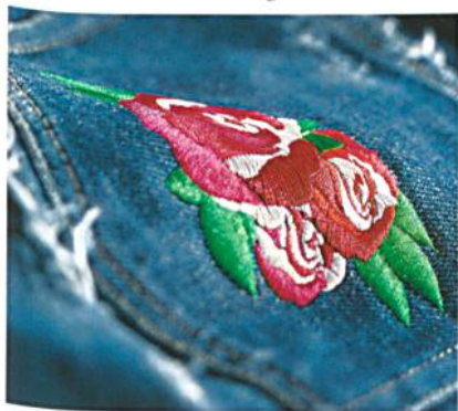
Abb. 2: Glanz ist nicht gleich Glanz bei Stickgarne – es kommt auf die Anforderungen an

Der Glanz des Stickmusters wird zum Teil durch das eingesetzte Garn, zum Teil durch die verwendeten Stiche und deren Länge definiert (Abb. 2).