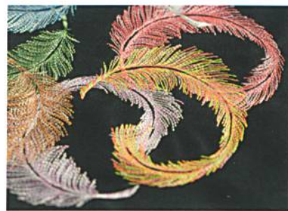
Abb. 3: Besonders bei feinen Textilien oder Maschenwaren muss technisch genau eingestellt werden

Hier wird es schon etwas technischer, denn für sich wölbende Muster gibt es mehrere Ursachen. Nicht immer wird das Bügeleisen dieses Problem lösen oder entschärfen können. Eine schüsselförmige Wölbung eines flächigen Stickmusters deutet oft auf eine zu hohe Stichdichte der Füllstiche hin. Bei Webwaren kann auch ein zu wenig straffes Einspannen im Rahmen eine Ursache sein (Abb. 3). Maschenwaren zeigen eher die Tendenz, wellig zu werden bzw. um die Stickerei herum zu strahlen. Dies rührt vor allem daher, dass die Stickerei die eigentlich elastische Ware an einer Stelle unelastisch macht. Daher dürfen