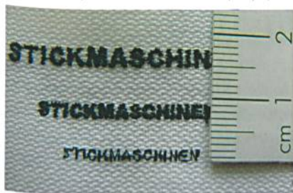
Abb. 6: Filigrane Details oder kleinste Schriftlen – kein Problem mit Serafil Feinstärken

Für alle detaillierten und filigranen Anwendungen ist Serafil in feinen Stärken die beste Wahl (Abb. 6). Für die feinste Stärke (200/2, was