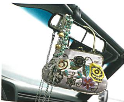
Abb. 1: Oft das Highlight eines Artikels: eine perfekte Stickerei

Woran kann ein «gutes» Stickmuster erkannt werden? Das Wichtigste ist zunächst die Optik (Abb. 1).