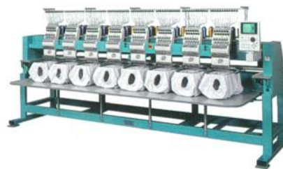
Abb. 1: Mehrkopfstickmaschine von Tajima

Die Zahl der Stickköpfe bestimmt die Anzahl der gleichzeitig ausführbaren Stickereien. Je mehr Köpfe, desto mehr Nadeln bewegen sich synchron. Einkopfmaschinen finden für Musterteile, Kleinserien und im Haushalt Verwendung. Mehrkopfstickmaschinen verfügen über 2 bis 50 Köpfe (Abb. 1).