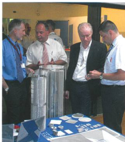
Abb. 7: Netzwerk Corners

am Kragen auf (Abb. 4), sobald der Arm gehoben wird, als ob man Samen sät. Mit einer Handbewegung werden projizierte Schmetterlinge aufgescheucht.