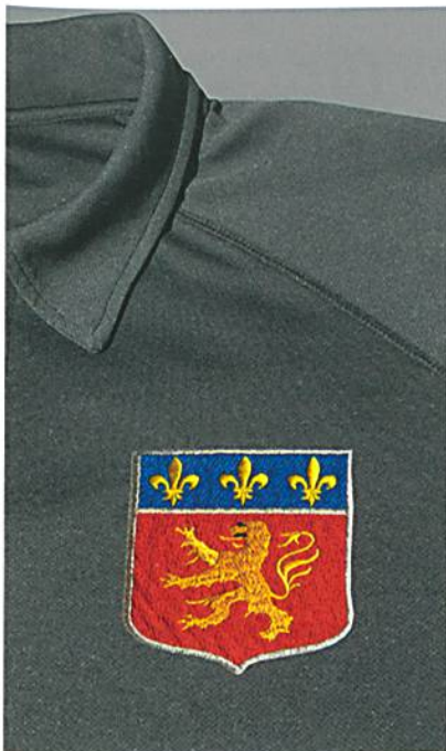
Abb. 3: Nach der Entfernung des Kleber-Schutzpapiers auf das Fertigteil verkleben

Seal ist in zwei Qualitäten – eine Bügel- und eine Thermopresse-Version – lieferbar. Den Arbeitsablauf zeigen die Abb. 2 und 3. Das Wappen wird passend mit E-ZEE Heat Seal verklebt. Nach der Entfernung des Schutzpapiers lässt sich das Wappen auf das Fertigteil kleben.