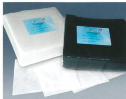
Abb. 1: E-ZEE Weblon, extrem hitzebeständiges Vlies in praktischen Zuschnitten, ideal für Maschenware

E-ZEE Weblon ist ein strukturiertes, angenehm weiches Schneidevlies, welches in weiss und schwarz lieferbar ist. Die Maschenwareprodukte sind mit normalen Vliesstoffqualitäten verstickbar. Reissvliesstoffe machen oft den Erfolg, eine dezente Stickerei faltenfrei aufs Shirt gebracht zu haben, beim Entfernen des Vliesstoffes wieder zunichte. Die bessere Alternative ist deshalb ein sauber um die Stickerei ausgeschnittener Vliesstoff, wie Weblon. Ein Vliesstoff, der auch nach dem Waschen eine bleibende Stabilität gewährleistet.