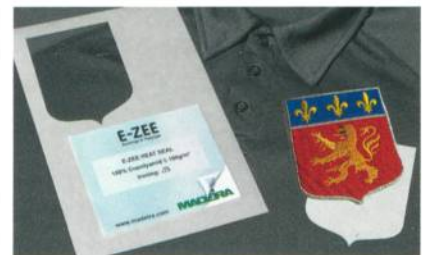
Abb. 2: E-ZEE Heat Seal – zuerst im passenden Zuschnitt mit dem Wappen verkleben

Es gibt jetzt auch für andere Aufgabenstellungen einen Standardvliesstoff von 40 g/m 2 aus 100 % Viskose. Es ist ein Reissvliesstoff, in der praktischen Zuschnittgrösse von 20 x 20 cm. Da er zu den Vliesstoff-Allroundern gehört, bietet Madeira ihn im 1'000er-Vorteilspack an. Sie werden es erleben – die Zuschnitte erleichtern Ihnen die Arbeit – also fangen Sie doch am besten gleich damit an.