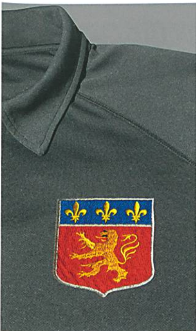
Abb. 3: Nach der Entfernung des Kleber-Schutzpapiers auf das Fertigteil verkleben

Seal ist in zwei Qualitäten – eine Bügel- und eine Thermopresse-Version – lieferbar. Den Arbeitsablauf zeigen die Abb. 2 und 3. Das Wappen wird passend mit E-ZEE Heat Seal verklebt. Nach der Entfernung des Schutzpapiers lässt sich das Wappen auf das Fertigteil kleben.