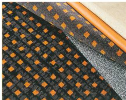
Abb. 1: Die neue Essentials Linie