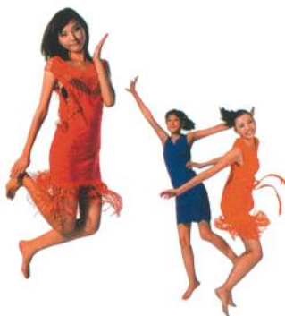
Abb. 2: Kollektion von KARL MAYER als Leistungsschau der DJ 4/2 EL

Komplettiert wird die Modellvielfalt durch das blaue Stretchkleid mit einer Musterung aus Orient-Ornamentals, das zum Outfit des Personals auf dem KARL MAYER-Stand zur ITMA ASIA+CITME 2010 gehörte.