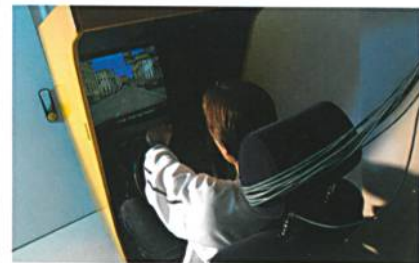
Abb. 1: In kontrollierten Sitzversuchen mit Testpersonen werden unter variierten Klimabedingungen die Temperaturen, relative Feuchte und Wärmeflüsse an verschiedensten Positionen im System Fahrer, Sitz und Fahrzeuginnenraum gemessen

quantitative Bewertung aktiv klimatisierter Kfz-Sitze ermöglichen. Dazu gehören die effektive Heiz- bzw. Lüfterleistung des Kfz-Sitzes, die tatsächlich am Fahrer ankommt, und die von der gesamten Sitzkonstruktion komplex abhängt, sowie Komfortschwellen für eine geregelte Sitzklimatisierung in stationären und instationären Fahrsituationen.