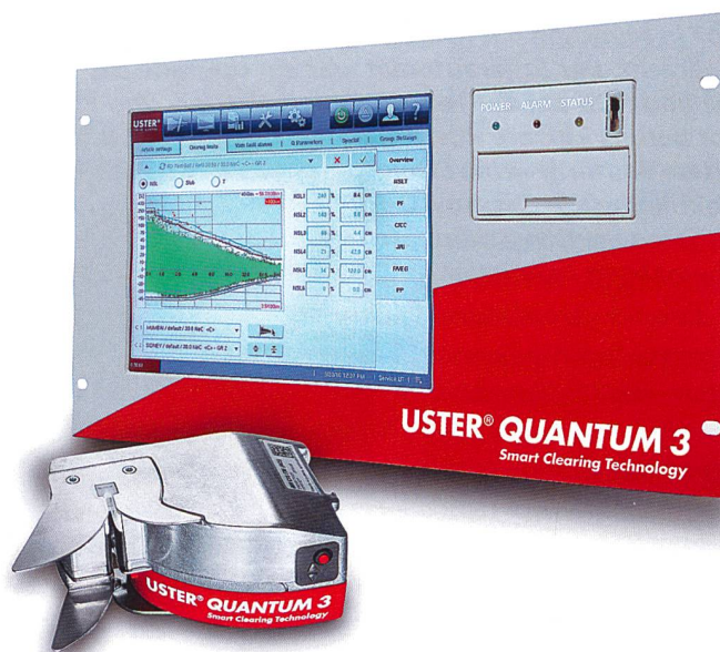
USTER® QUANTUM 3

Nicht nur die Sensor-Technologie hat sich einen grossen Schritt weiterentwickelt. Der USTER® QUANTUM 3 besitzt auch ein neues zentrales Steuergerät mit einem 14-inch Touchscreen und einem grösseren und schnelleren Speicher. Diese Einheit kann in Echtzeit mit der neuen Generation des USTER® QUANTUM EXPERT SYSTEM kommunizieren, was ihr beispielsweise ermöglicht, Vergleiche von veränderten Reinigungseinstellungen an jeder Spulstelle anzustellen und eine Synchronisierung ähnlicher Garnlose durchzuführen.