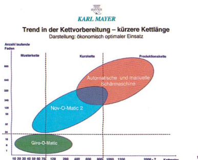
Abb. 5: Platzierung der Nov-O-Matic 2 am Markt

Mit ihrem Arbeitsprofil füllt die effiziente Hightech-Maschine die weissen Flecken in der Anwendungstopografie zwischen den Modellen der konventionellen Schärmaschinen und den Musterkettenschärmaschinen der Giro-O-Matic-Baureihe aus. Insbesondere bei der Fertigung von Webketten mit kürzeren Längen und geringeren Bandbreiten entfaltet der Newcomer seine volle Effizienz. Die Formatänderungen nach unten machen den Einsatz dieser Musterkettenschärmaschine und nach oben jenen der konventionellen Sektionsschärmaschine zunehmend interessanter (Abb. 5).