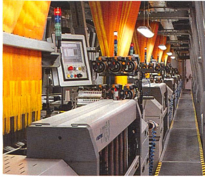
Abb. 3: VTR33 für italienischen Samt, installiert in Indien

Im Möbelstoffbereich besteht gegenwärtig ein Trend hin zu gewobenem italienischem Samt. Dafür steht die Velvet Tronic VTR33 (Abb. 3)