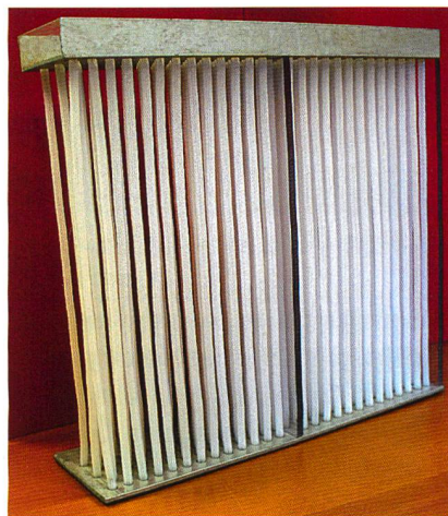
Gestrickte Kederschläuche von STRÄHLE + HESS

Damit wagt sich auch das Althengstetterer Unternehmen, das sich weltweit durch technische Spezialtextilien für die Autobranche einen Namen gemacht hat, auf Neuland, um so an seinen Umweltpreis der Sparkassen-Stiftung Pforzheim Calw aus dem Jahre 1999 an-