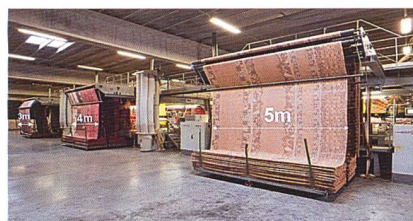
Abb. 1: Im Vergleich zur Standardbreite von 4 Metern ermöglicht die 5 Meter breite Maschine Kombinationen von 2 und 3 Meter breiten Teppichen und Läufern

Der Vorteil der Breite von 5 Metern wurde von zahlreichen Unternehmen im Fernen Osten (Usbekistan, China), im Mittleren Osten (Türkei, Syrien, Saudi Arabien, Iran) und in Europa (Belgien, GB und Irland) bestätigt (Abb. 1).