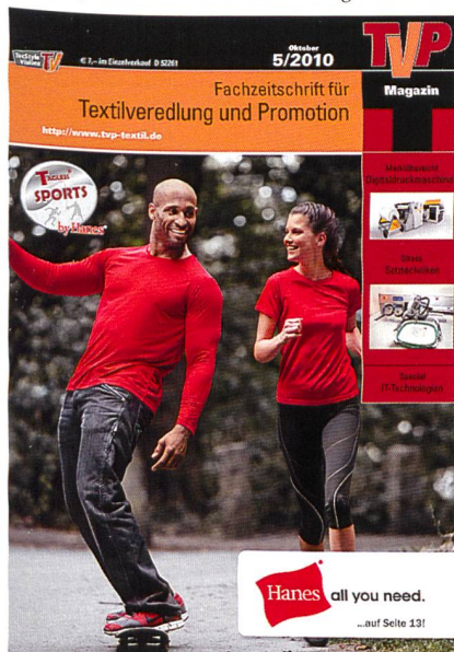
Abb. 2: Fachzeitschrift «TVP Textilveredlung & Promotion»

Das Buch «PUNCH» ergänzt das umfassende Verlagsprogramm der deutschen Verlagshaus Gru-