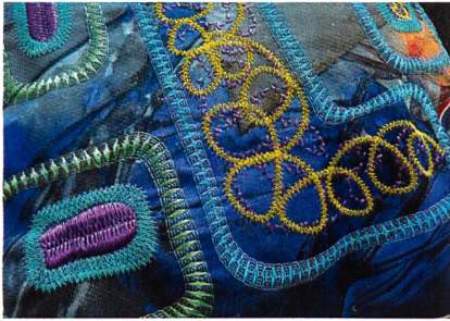
Abb. 2: Design von Bonnie Nielsen /Madeira zu anderen Spulenaufmachungen ist die MSC konenförmig, was das Herunterfallen des Garnes verhindert. Bei jedem Farbwechsel ermöglicht die Snap-Vorrichtung das einfache Einklemmen des Garnendes am Spulenfuss, sodass die Sticker ihre verschiedenen Farben ohne Garnverlust lagern können. Maschinen mit mehr und mehr Nadelstellen pro Kopf bieten nicht immer genug Raum für die gewünschte Anzahl von Spulen – hier spielt der extrem kleine Durchmesser der MSC eine sehr vorteilhafte Rolle.

Die neue MSC-Aufmachung wird nach und nach in den folgenden Qualitäten geliefert: