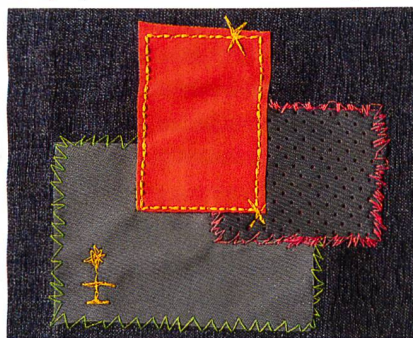
Abb. 3: Kreative Designideen mit Frosted Matt in allen Varianten zur Verwirklichung der aufregendsten Stickereieffekte. Wahrhaftig eine «chance to change» gibt Madeira allen, die an Stickerei glauben.

Das stark ausgeprägte Bekenntnis von Madeira zur Qualität in Stickerei spiegelt sich in der aussergewöhnlichen Vielfalt des Produktprogrammes: wunderbare Mischoptionen